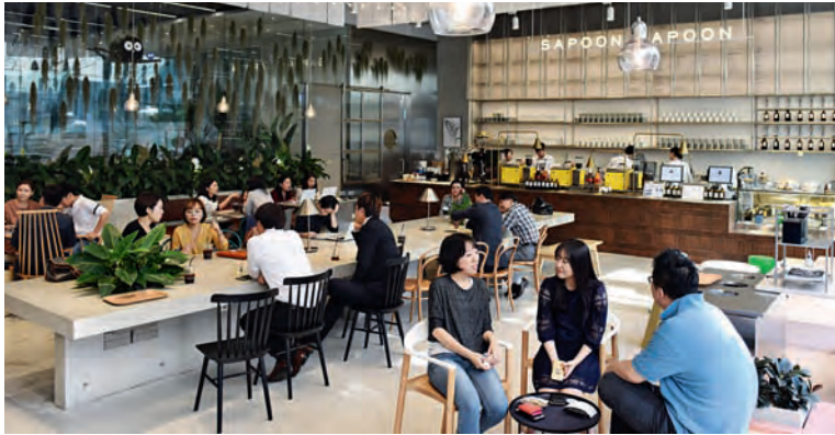
Hotspots in Seoul: das Café Sapoön Sapoön (oben) und das Spa-G, das auf Ginseng-Behandlungen spezialisiert ist (rechts); Pharmakologe Sang-Min Lee (ganz rechts) erforscht die Wirkstoffe der Wurzel